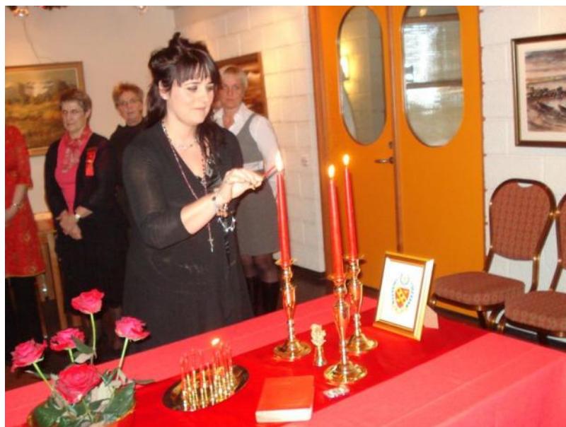
Nýir félagar teknir inn í deildina

Sameiginlegur fundur Zeta- og Betadeildar var svo haldinn laugardaginn 4. október í Mývatnssveit og var ákaflega vel lukkaður. Fundurinn hófst með sameiginlegu borðhaldi og undir borðum var slegið á léttu strengi ásamt því að landssambandsforseti flutti okkur fréttir af starfi landssambandsins. Að borðhaldi loknu fórum við í stutta gönguferð og nutum hinnar fögru náttúru Mývatnssveitar. Ferðin endaði svo á heimsókn í fuglasafn Sigurgeirs.