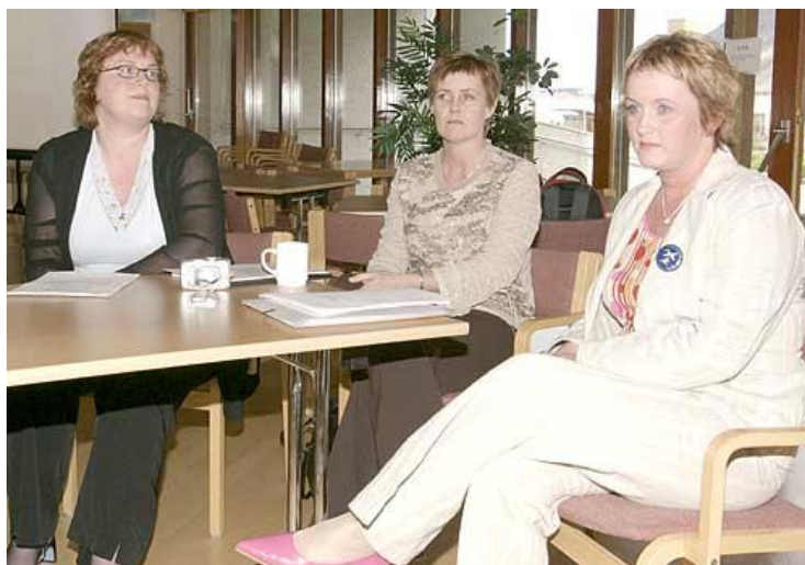
Fyrstu ljósmæðurnar sem útskrifuðust úr fjarnámi á Ísafirði vorið 2004.