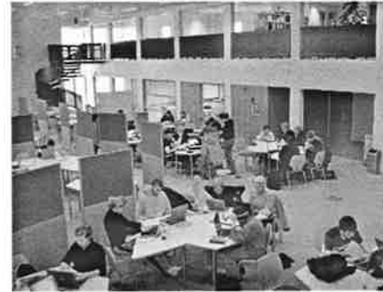
Séð yfir stærsta námsrýmið – nemendur niðursokknir í vinnu sína

Skólinn er í Grundarfirði og er framhaldsskóli með áfangasniði, eins og flestir framhaldsskólar á landinu, en er að öðru leyti um margt nýstárlegur. Hugmyndafræði skólans byggir á hugmyndum um opin skóla og var skólahúsnæðið hannað með tilliti til þess. Það er því lítið um hefðbundnar kennslustofur í skólanum en í staðinn eru margs konar rými, opin eða hálfopin, sum stór og önnur minni. Mikil áhersla er lögð á að skapa góðan vinnuanda og vinnuástöðu í skólanum og að nemendur skipuleggi tíma sinn sjálfir að nokkru leyti. Stundatafla er sveigjanleg og eru nemendur ýmist í föstum kennslustundum með mætingaskyldu eða verkefnatímum. Í verkefnatímum er ekki skipulögð kennsla heldur vinna nemendur að verkefnum sínum, en hafa aðgang að kennurum sínum ef þeir þurfa aðstoð. Nemendur ákveða sjálfir hvaða verkefnatíma þeir velja og geta því fengið meiri aðstoð í þeim greinum sem þeir þurfa á að halda. Nemendur eru hvattir til að nýta verkefnatímanna vel og þeir sem það gera geta lokið mestallri „heimavinnu“ áður en þeir fara heim á daginn.