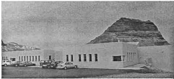
Skólinn með Kirkjufell í baksýn

Fjölbrautaskóli Snæfellinga var stofnaður 2004 og er í eigu sveitarfélaganna á norðanverðu Snæfellsnesi; Grundarfjarðar, Helgafellssveitar, Snæfellsbæjar og Stykkishólms, ásamt ríkinu.