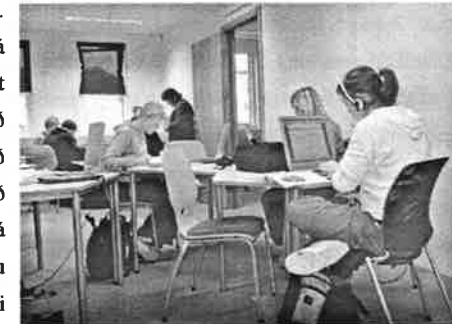
Nemendur við vinnu sína – með stærðfræðikennarann innan seilingar

Mikið þróunarstarf fer fram í skólanum á þessum tveimur sviðum og margt spennandi að gerast. Má þar nefna að hefðbundnar kennsluáðferðir með áherslu á fyrirlestraformið hafa vikið fyrir aðferðum sem gera kröfu á nemendur að þeir séu virkir í námi sínu og læri námsefnið í gegnum verkefni sem þeir vinna.