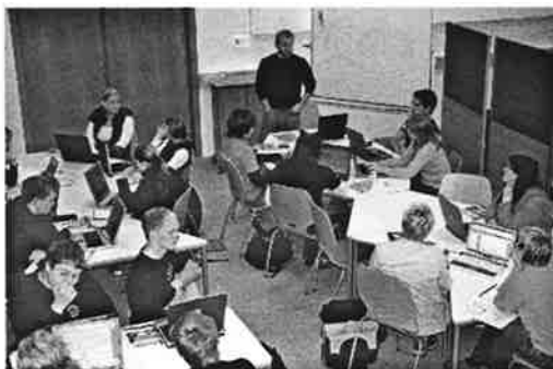
Nemendur í enskútíma hlusta á kennarann áður en þeir fara að vinna

Aðsókn að skólanum hefur verið mjög góð og miklu meiri en áætlanir gerðu ráð fyrir. Þannig voru rúmlega 100 nemendur í skólanum strax á fyrstu önn og núna eru um 220 nemendur í skólanum. Stærsti hópurinn er 16 til 20 ára nemendur í venjulegu dagskólanámi.